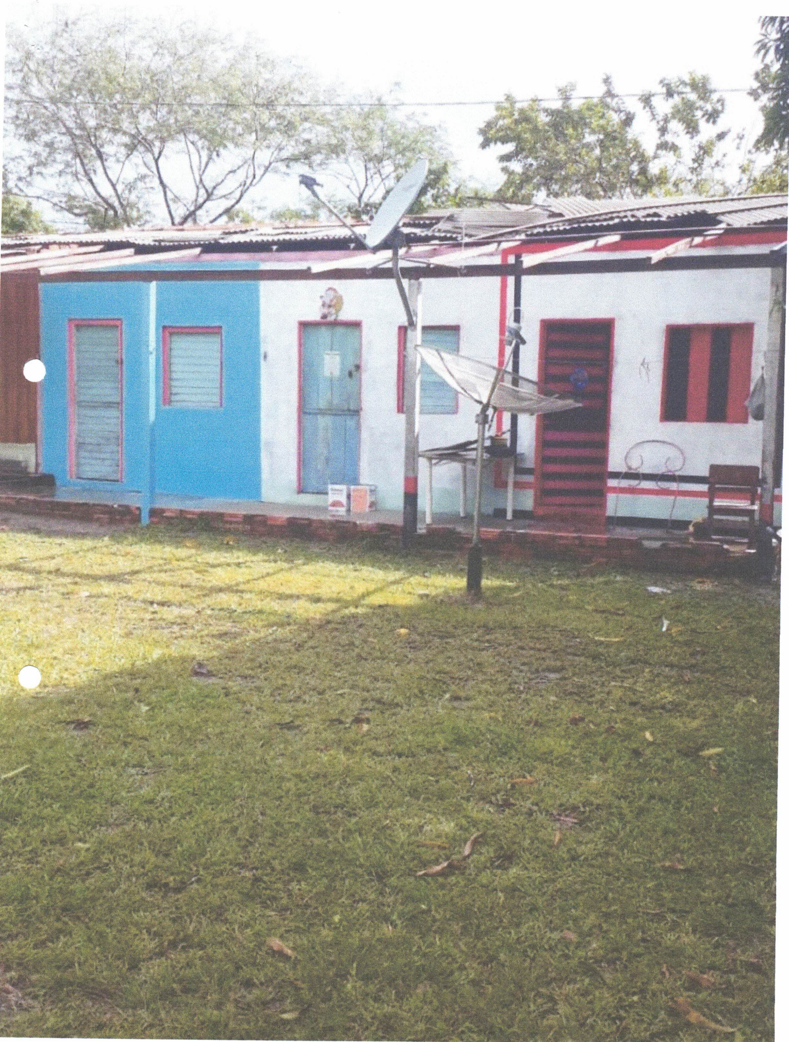
ALOSAMENTO / PROFESSORES